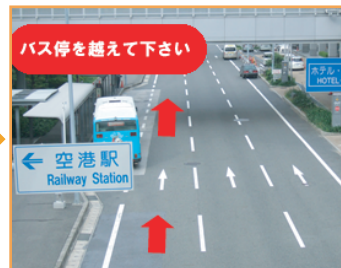
② バス停を越え前進して下さい