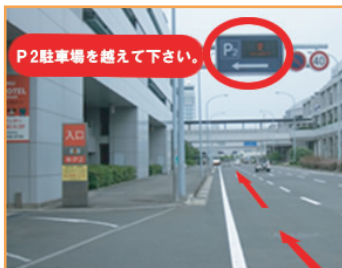
① P2駐車場を越えて前進して下さい