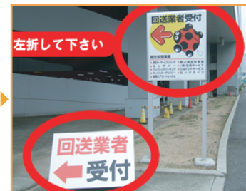
③ 回送業者受付カンバンを左折