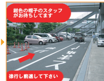
★ 紺色の帽子をかぶったスタッフがお待ちしております！